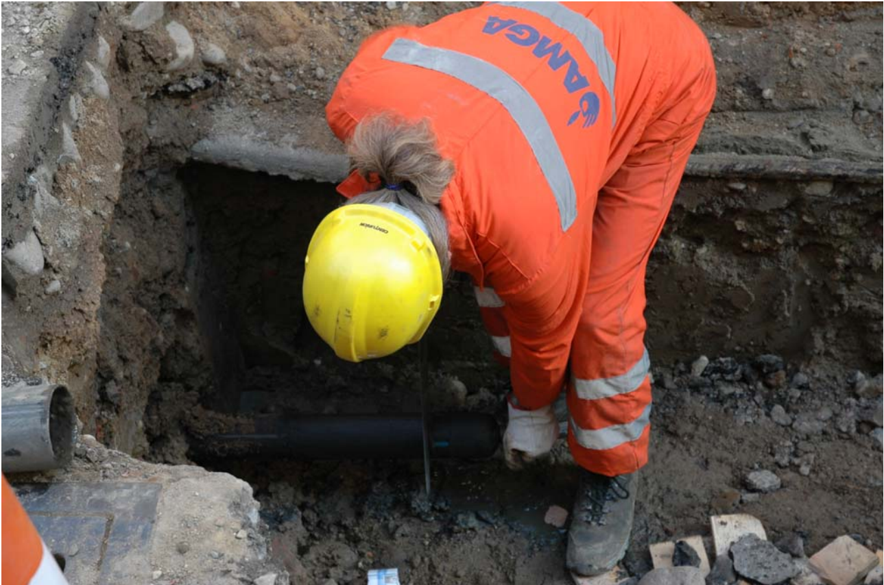
taglio della testa di traino per la successiva realizzazione del raccordo di estremità alla condotta esistente

Si impiegano tubazioni in PEAD di tipo commerciale.