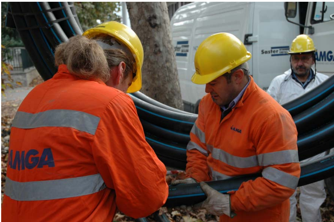
preparazione del rotolo di tubo in PEAD DE90 mm

Questa tecnica, nella fattispecie denominata "pipe bursting" consente infatti di sostituire l'esistente condotta in materiale fragile (ghisa grigia in questo caso), con la contestuale posa in opera di una nuova condotta in polietilene anche di diametro sensibilmente maggiore (in questo caso un DE90 mm PN10).