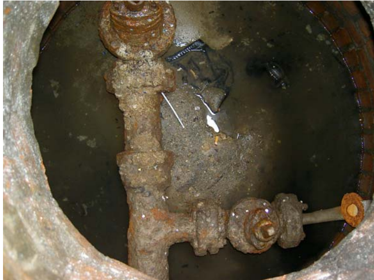
la evidente condizione di estrema vetustà delle esistenti condotte in ghisa grigia

In relazione al tipo di pavimentazione ed alla intensa frequentazione pedonale e veicolare della zona, è facile immaginare quali potevano essere le problematiche da affrontare al momento di aprire un cantiere di scavo a cielo aperto per la sostituzione delle due condotte.