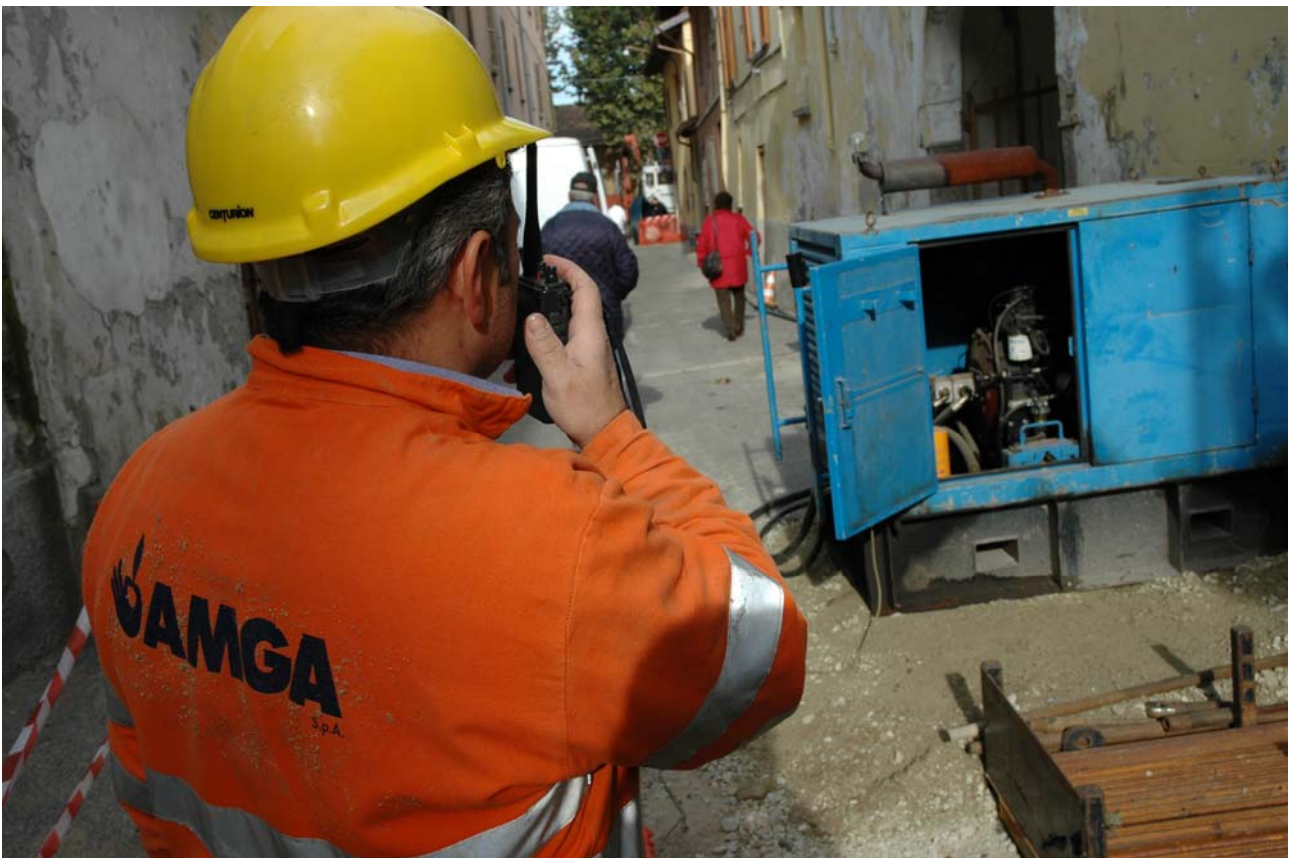
aspetto esterno del cantiere

PRO: l'impiego di tale tecnologia può consentire sensibili incrementi di portata, anche fino al 100-150% considerando gli aumenti di sezione netta di deflusso ottenibili con la posa di tubazioni in PEAD di diametro nettamente superiore alle condotte esistenti.