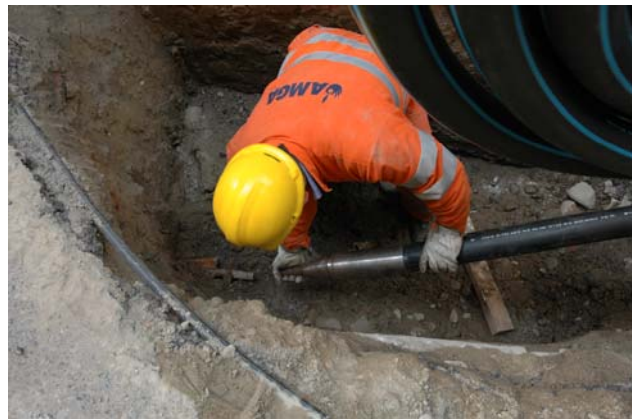
saldatura della testa di traino e collegamento del tubo in PEAD al cono alesatore ed al dispositivo di frantumazione

Le aste vengono inizialmente introdotte all'interno del tratto di condotta da sostituire, per tutta la sua lunghezza, sino a raggiungere l'altro scavo (camera di arrivo) posto all'altro capo.