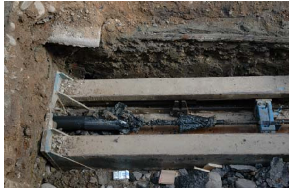
fasi di inserzione del tubo in PEAD e di sostituzione della vecchia condotta