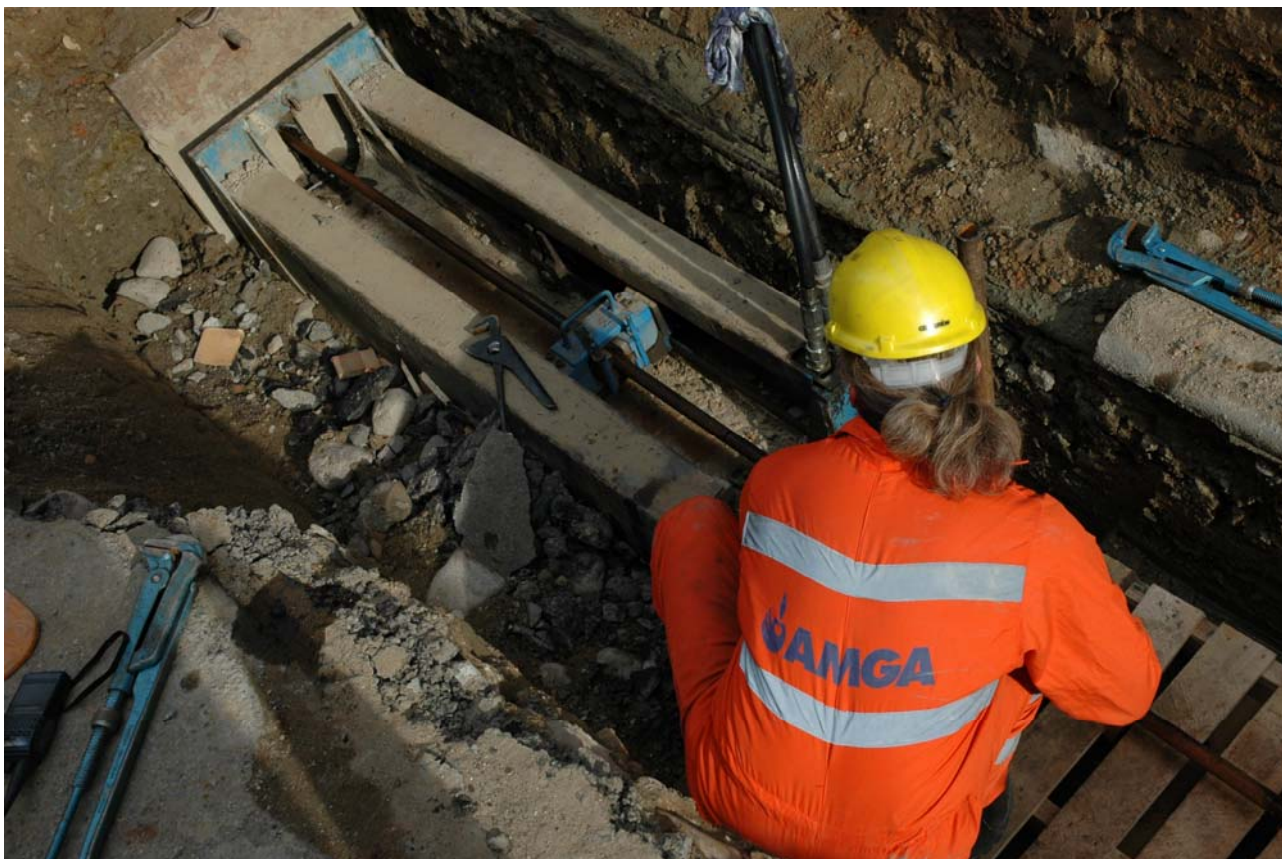
estrazione delle aste azionate idraulicamente che trainano il dispositivo di frantumazione, l'alesatore e la nuova tubazione in PEAD

Man mano che le aste vengono estratte viene così creato il foro di diametro maggiorato che costituisce la sede di posa per la nuova tubazione di PE. Questa è agganciata al treno di aste, direttamente a valle del dispositivo di frantumazione e dell'ogiva conica ed è trascinata all'interno del nuovo foro durante la fase di estrazione delle aste.