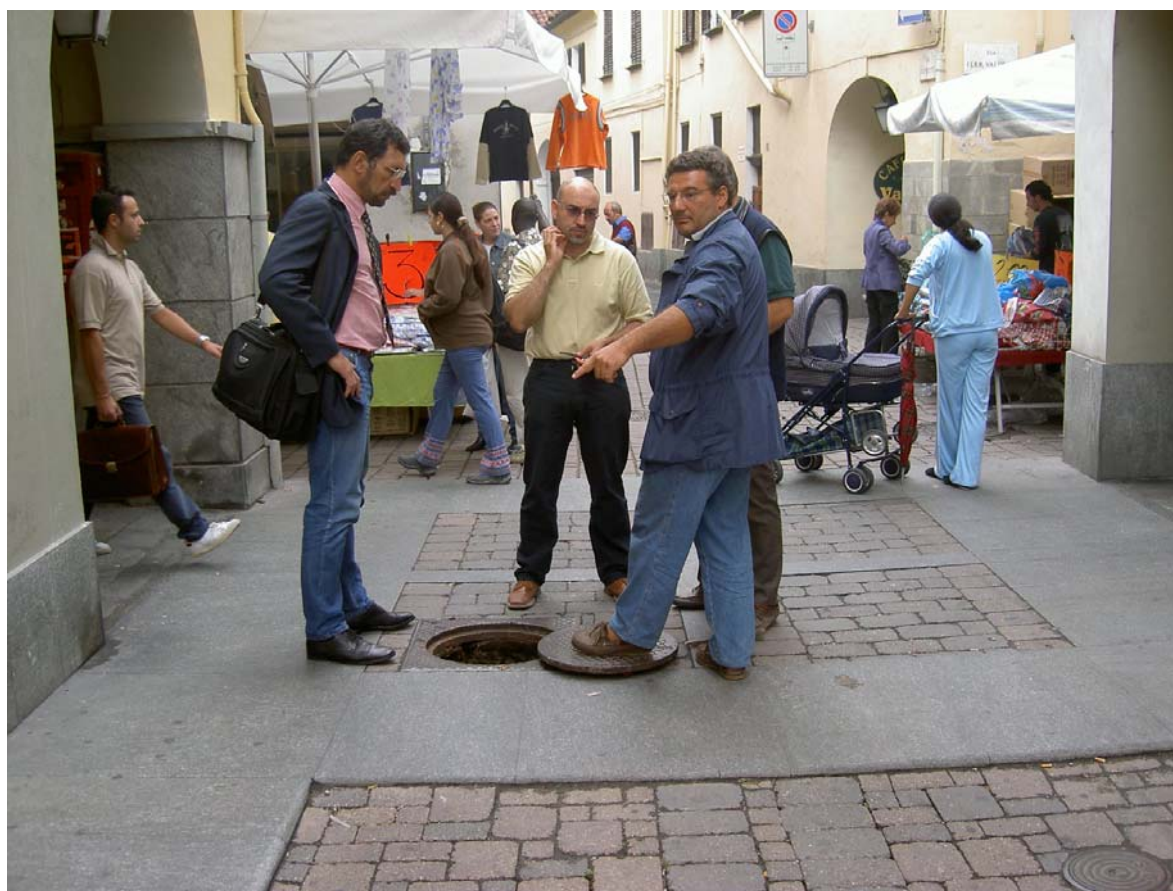
Via Valobra a Carmagnola in giornata di mercato. Tecnici della SAP e di Saster Pipe valutano preventivamente alcuni aspetti del progetto di relining

Breve cronaca illustrata di una delle possibili soluzioni No-Dig per il rimpiazzo di condotte anche di piccolo diametro.